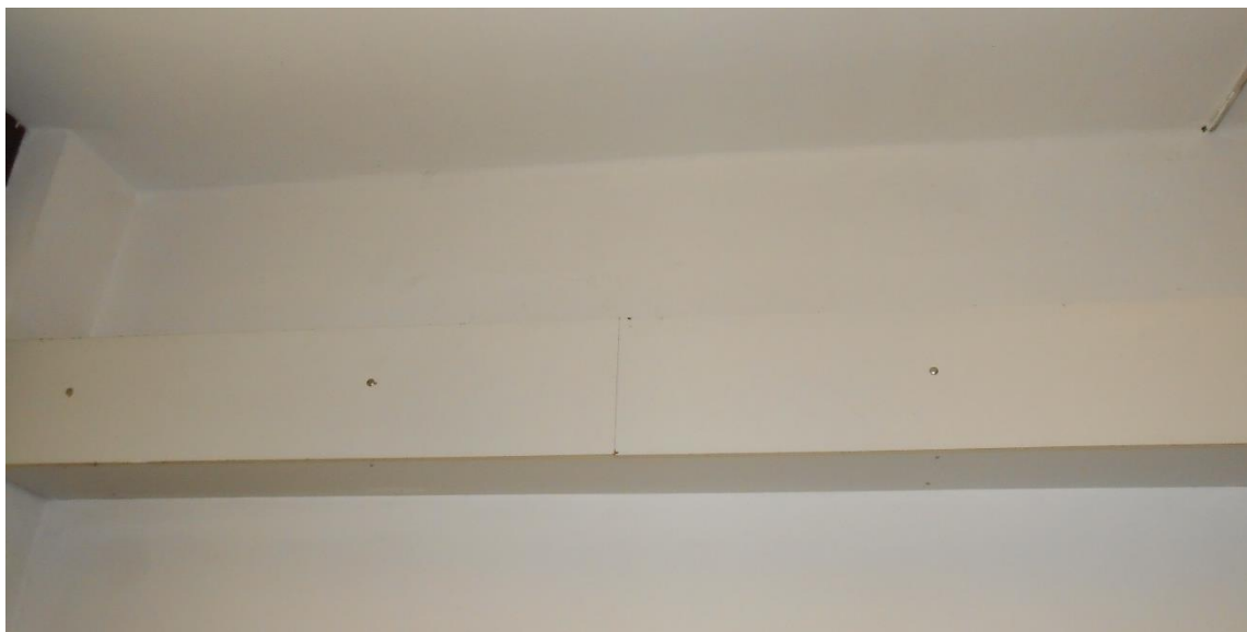
Slika šte. 6: vodoravna razpoka na stiku naknadne pozidave pod nosilcem bivšega stebrišča v pritličju

V notranjosti so sicer v pritličju in nadstropju vidne predvsem poševne razpoke večinoma zidanih prečnih (predelnih) sten (slika šte. 7) (na enem mestu je predelna stena prestrižena vodoravno), mestoma pa tudi od vogalov oken, predvsem v nadstropju pri oknu hodnika (slika šte. 8), kjer se te razpoke navezujejo tudi na razpoke vzdolžnih zidov hodnika. Domnevamo, da gre pretežno za potresne poškodbe nastale ob nihanju stavbe.