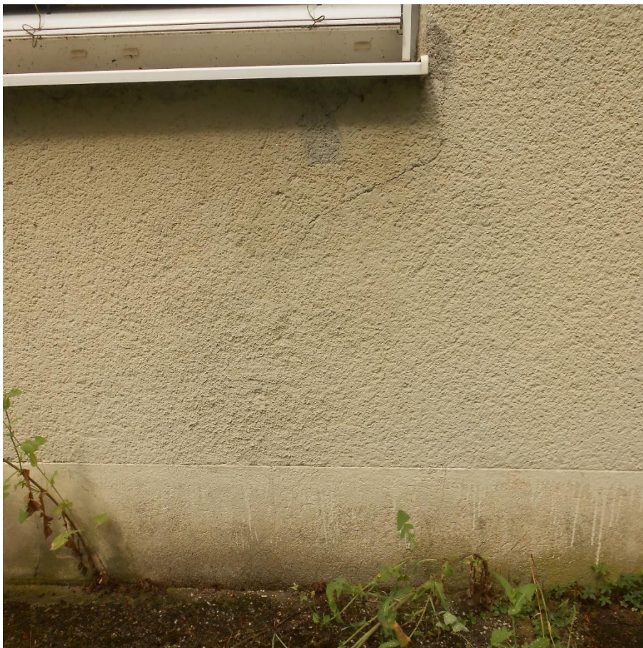
Slika števil. 4: razpoka zidnega nastavka vzdolžnega fasadnega zidu, ki sega do vogala okna

Domnevamo, da je do diferenčnega posedanja mestoma prišlo med drugim tudi zaradi zamašenih jaškov navpičnih odtokov strešnih žlebov in posledično izpiranja finih frakcij temeljnih tal skozi desetletja.