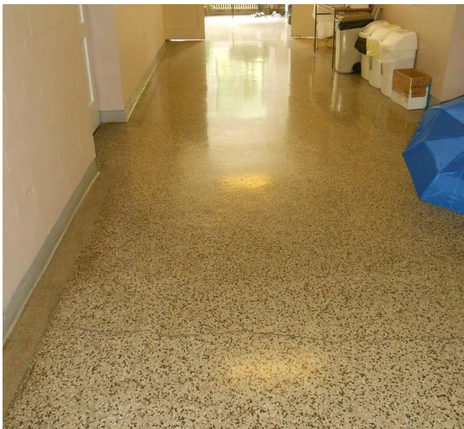
Slika šte. 9: prečno razpokan teraco hodnika

Teraco tlak hodnika v pritličju in nadstropju je razpokan, predvsem v prečni smeri a tudi po sredi vzdolžno po celi dolžini hodnika, kar je spričo nedilatiranosti pričakovano (slika šte. 9). Te poškodbe, ki načeloma niso konstrukcijske, v nadaljevanju niso obravnavane (lahko pa se jih sanira z urezovanjem dilatacij in polnitvijo s trajno elastičnimi kiti).