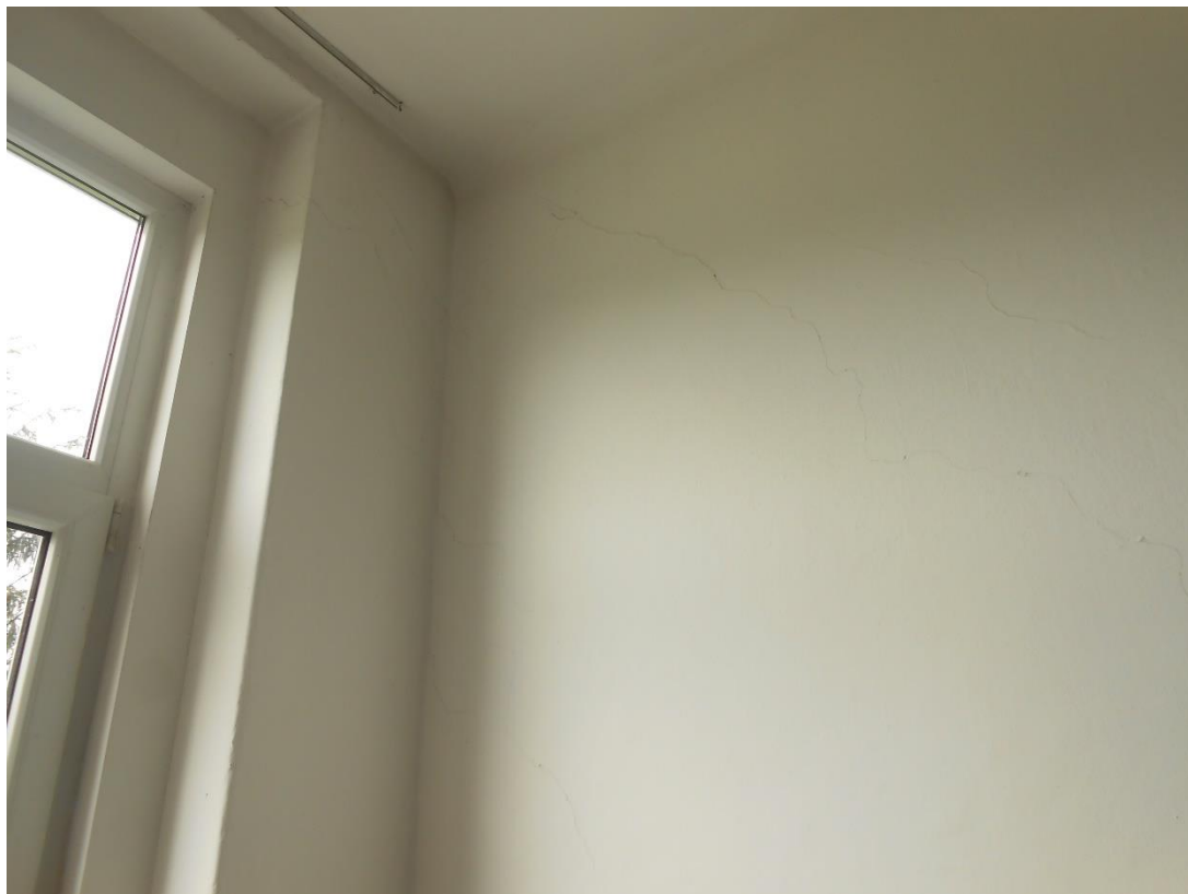
Slika šte. 7: fotografija poševne strižne razpoke zidu

V notranjosti so sicer v pritličju in nadstropju vidne predvsem poševne razpoke večinoma zidanih prečnih (predelnih) sten (slika šte. 7) (na enem mestu je predelna stena prestrižena vodoravno), mestoma pa tudi od vogalov oken, predvsem v nadstropju pri oknu hodnika (slika šte. 8), kjer se te razpoke navezujejo tudi na razpoke vzdolžnih zidov hodnika. Domnevamo, da gre pretežno za potresne poškodbe nastale ob nihanju stavbe.