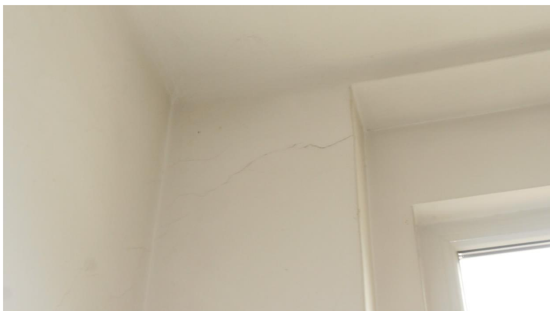
Slika šte. 8: fotografija razpoke od vogala okna v nadstropju južne čelne stene

Teraco tlak hodnika v pritličju in nadstropju je razpokan, predvsem v prečni smeri a tudi po sredi vzdolžno po celi dolžini hodnika, kar je spričo nedilatiranosti pričakovano (slika šte. 9). Te poškodbe, ki načeloma niso konstrukcijske, v nadaljevanju niso obravnavane (lahko pa se jih sanira z urezovanjem dilatacij in polnitvijo s trajno elastičnimi kiti).