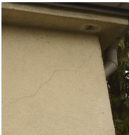
Slika šte. 5: fotografije razpok južnega obodnega zidu, zgoraj v pritličju ob JV vogalu, spodaj levo pri oknu v nadstropju in spodaj desno v JV vogalu pod steho

V notranjosti so mestoma na stikih pozidav bivšega stebrišča na severni strani objekta vidne tanjše razpoke, in sicer predvsem v hodniku na stiku z zgornjimi nosilci (slika šte. 6).